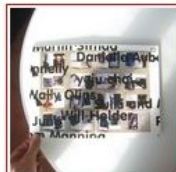
Tomáš Procházka Relace