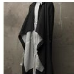
Jindra Jansová Základní